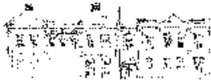
Illustration: Bernhard Handell

Information och anmälan: församlingsexp. tel 15 75 00 eller e-post: sanktolai.pastorat@svenskakyrkan.se