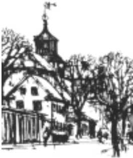
Illustration: Bernhard Handell